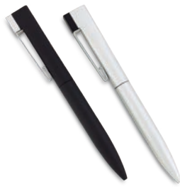
US-03 / Memoria USB Bolígrafo Slim Bolígrafo metálico USB. Colores con Acabado en Caucho. Medidas: 14,5 cm Marca: 3,5 cm / Láser Capacidad: 4GB / 8GB / 16GB